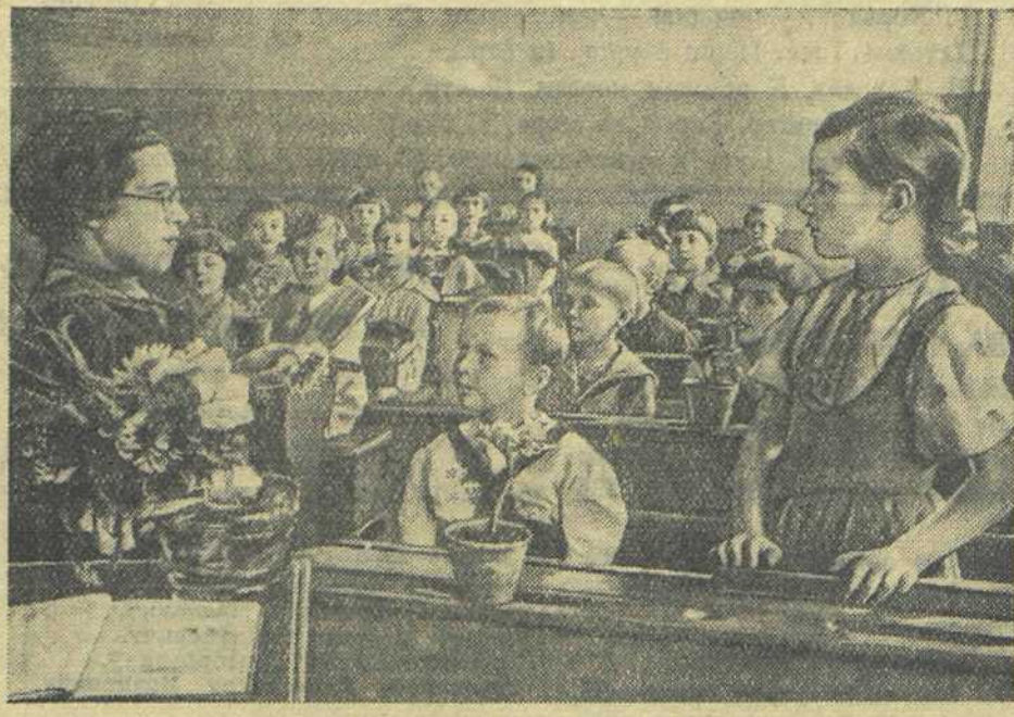
НАЧАЛО УЧЕБНОГО ГОДА. На первом уроке в 1-м классе «А» 33-й средней женской школы Краснопресненского района г. Москвы...